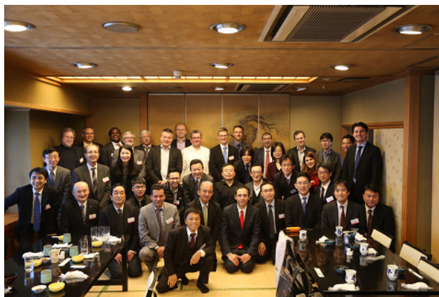
EPIC と光集積技術に関する Workshop を開催